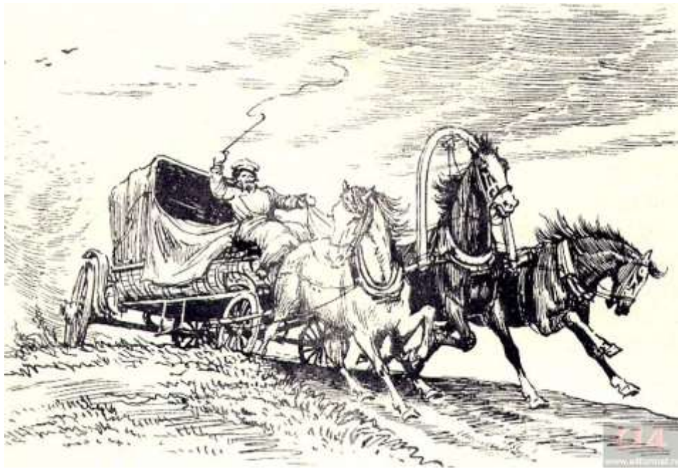
Русь-тройка. Художник А. Лаптев